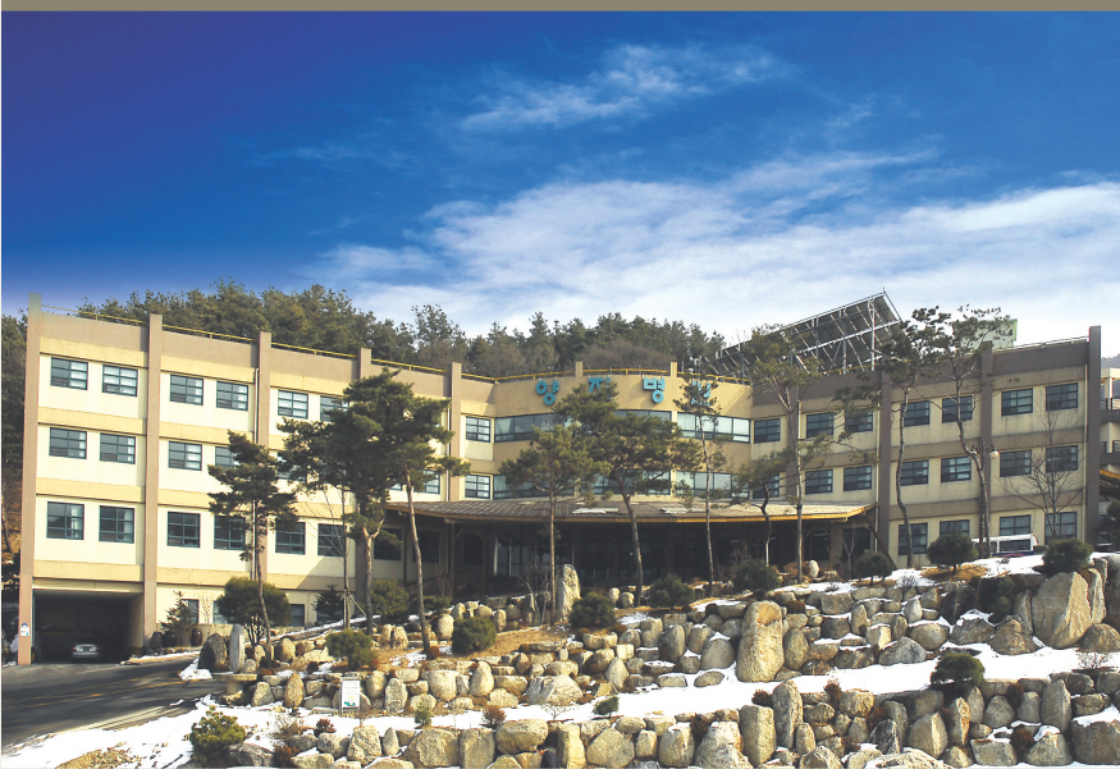
YANG JI GERIATRIC MEDICAL CENTER